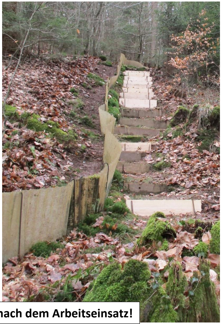
Zaun und Treppenanlage nach dem Arbeitseinsatz!